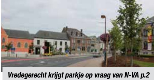
Vredegerecht krijgt parkje op vraag van N-VA p.2