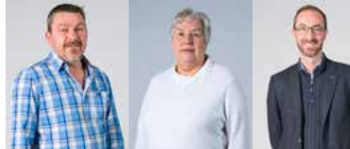
N-VA'ers in de kijker p.3