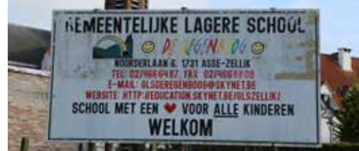
Onderwijs kan steun gemeente gebruiken p. 3