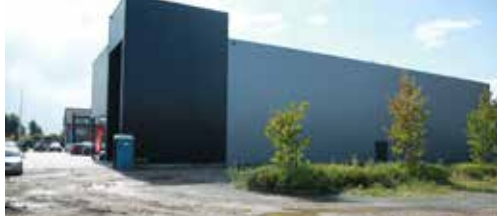
Gemeentebestuur negeert burenbaanwinkel p. 2